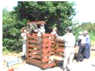
組み立て作業の風景

間伐材をさまざまな資材として利用することで、エネルギーを節約し、二酸化炭素の排出を少なくすることができ、地球の温暖化防止に貢献することになります。