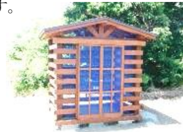
完成したゴミ集積所